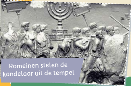
Romeinen stelen de kandelaar uit de tempel

O oit heb ik iemand horen zeggen: 'Als je niet kunt geloven in God, kijk dan naar het wonder van het volk Israël.' Veel van de beloftes in de Bijbel, de profetieën over Israël, zijn vervuld. Aan de geschiedenis van Israël kun je zien dat de God van Israël de levende God is. Hieronder lezen we een aantal dingen die zijn voorgezegd in de Bijbel en die inmiddels zijn uitgekomen.