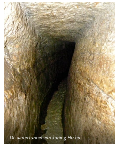
De watertunnel van koning Hizkia.