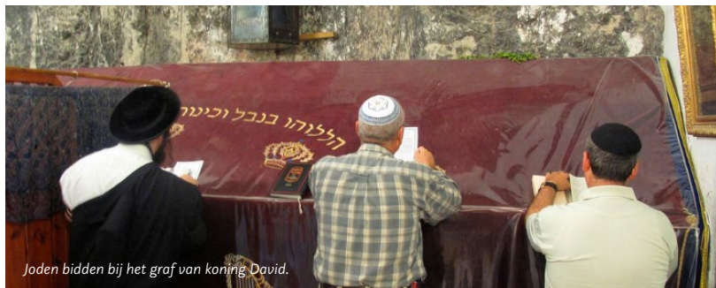
Joden bidden bij het graf van koning David.

verbergt zich vaak weken aan een stuk in de grotten rond de Dode Zee. Wanneer Saul eenmaal gestoven is, keert David terug naar Juda en wordt daar Koning. Dit alles gebeurt ongeveer 3000 jaar geleden. Iets heel belangrijks wat David deed tijdens zijn koningschap, is dat hij Jeruzalem als hoofdstad maakte. Jeruzalem wordt daarom ook wel Stad van David genoemd.