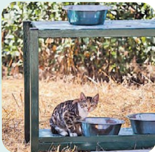
Een kat in de tuin van het parlement.