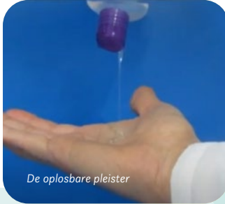
De oplosbare pleister

Heb jij het ook wel eens gehad dat je een pleister moest losmaken van je lichaam die heel vast zat? Dat kan best pijn doen! Een Israëliisch bedrijf heeft hier nu een oplossing voor bedacht. Ze hebben een oplosbare pleister ontworpen. De pleister bestaat uit een soort gel die je op de wond kan smeren waarna de gel hard wordt. Als je water met een bepaalde temperatuur op de gel doet, dan wordt de gel weer vloeibaar en kan je het makkelijk en pijnloos van de wond halen. Het voordeel van deze pleister is ook dat hij doorzichtig is waardoor je een wond goed in de gaten kan houden. Weer een mooie uitvinding uit Israël!